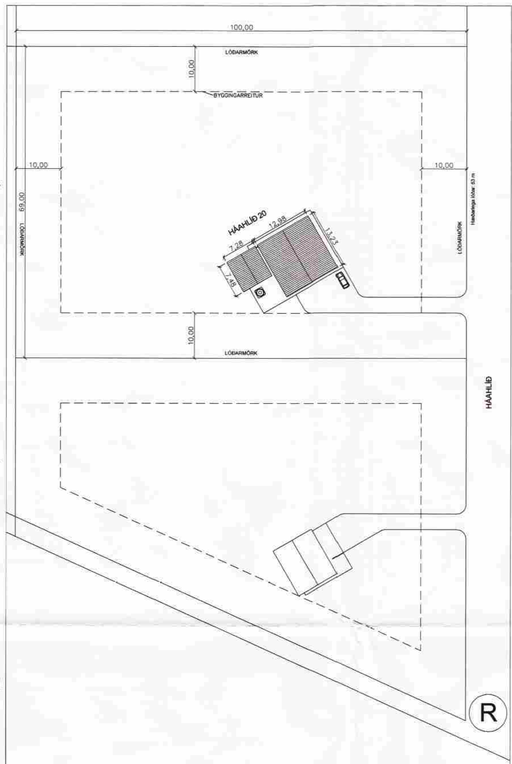
AFSTÖÐUMYND MKV. 1:500