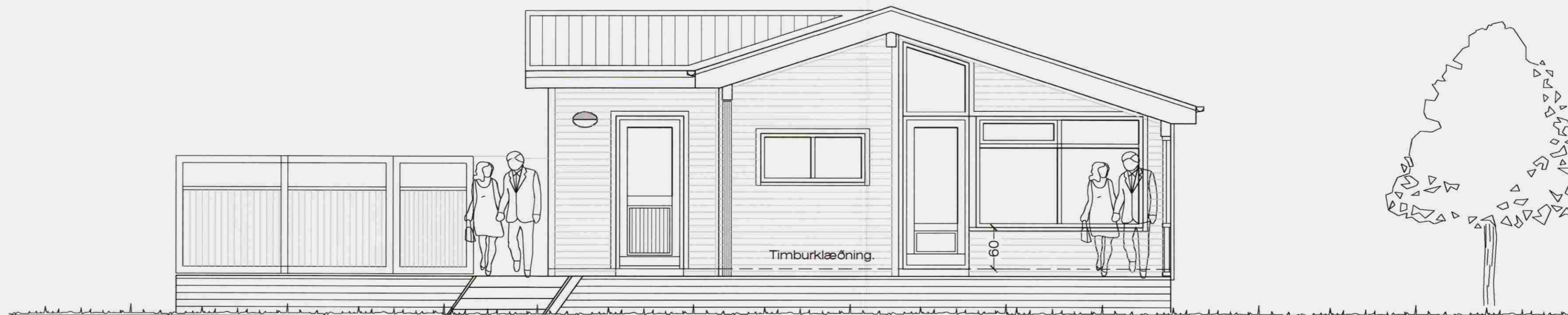
Suð - vesturhlíð. 1 : 50

Kjarrengrí 3, í landi Miðengis. Útlit - Sneiðing. VERK. NR. 19.-3.-2008 MÁL. 1:50 TEIKN. NR. 03 BREYTT. JÓN GUÐMUNDSSON ARKITEKT Jón Guðmundsson VINNUSTOFA SUÐURLANDSBRÁUT 16 REYKJAVÍK SÍMI 552 5055