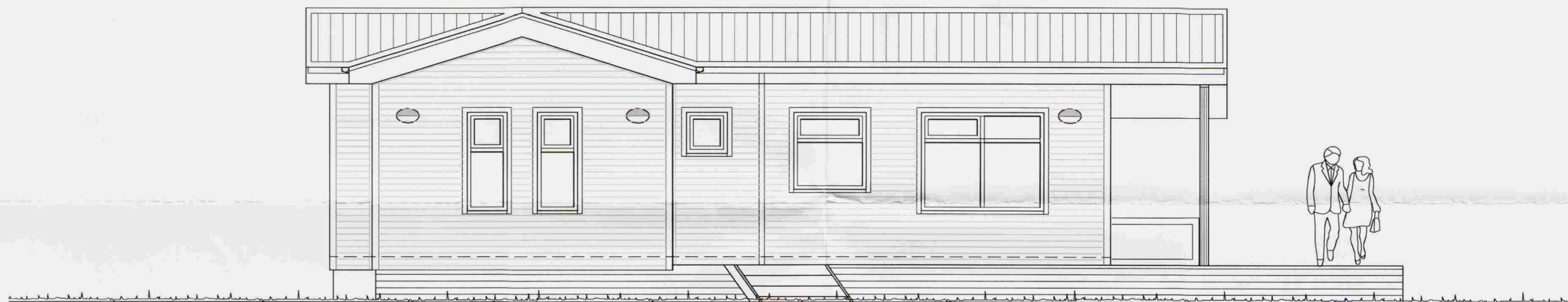
Norð - vesturhlíð. 1 : 50

Hæðarsetja skal húsið í samráði við byggingarfulltrúa á staðnum.