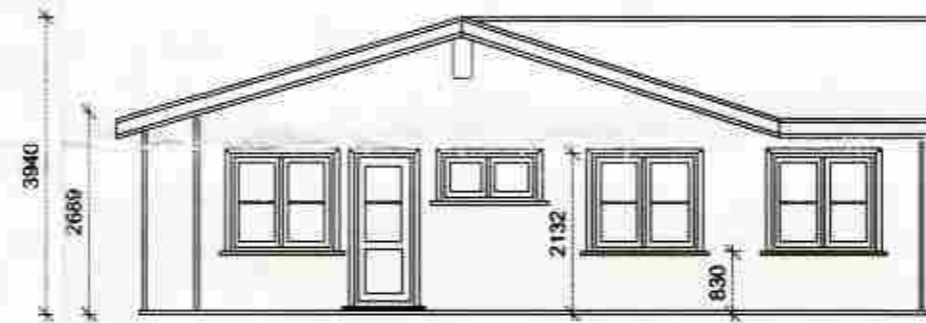
HÆÐARMÁLSETNINGAR MK. 1:100