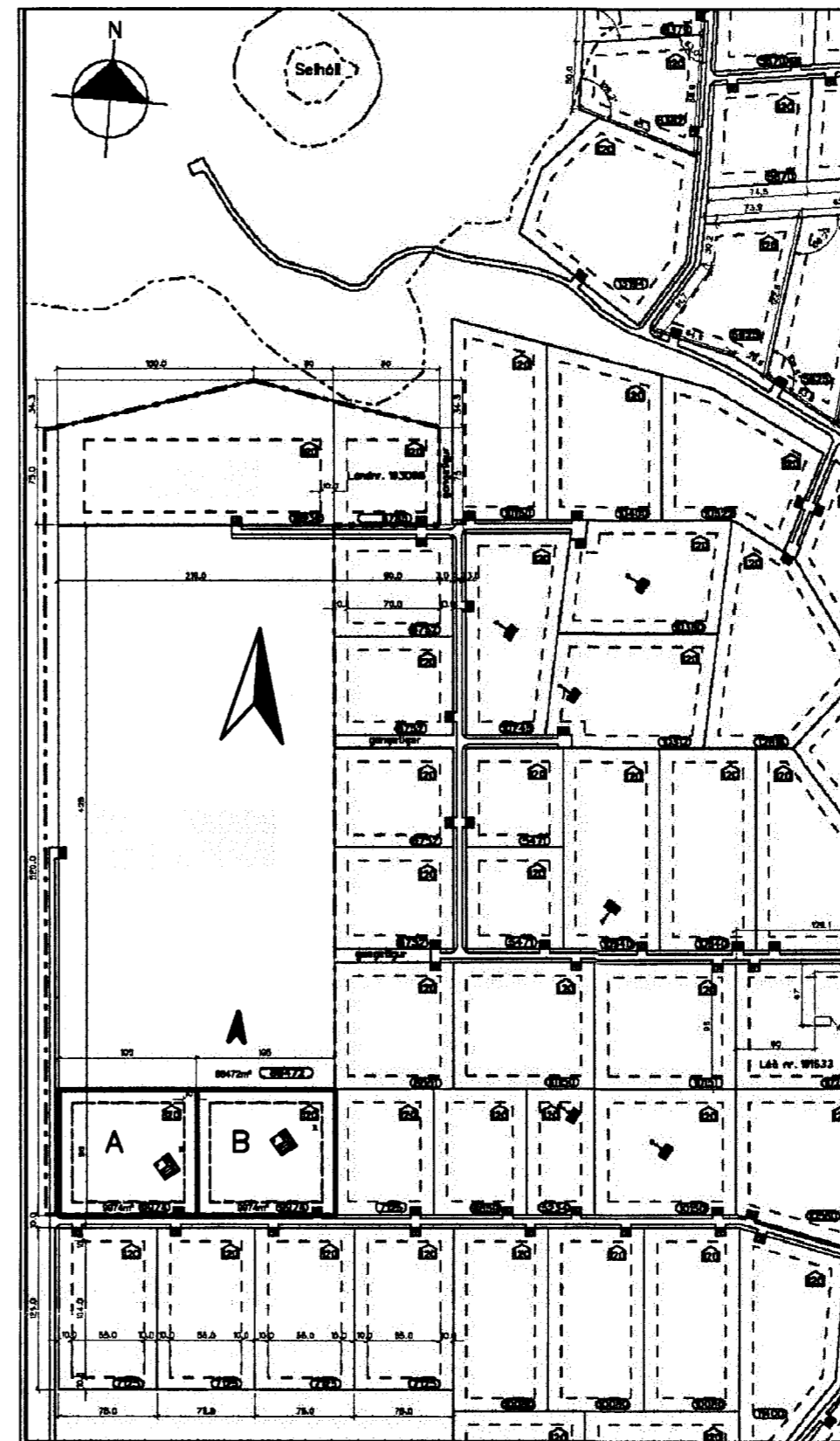
Selhóll, lóðir í landi hæðarenda. Mkv. 1:5000