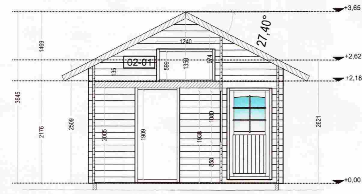
Snió B-B 1:50