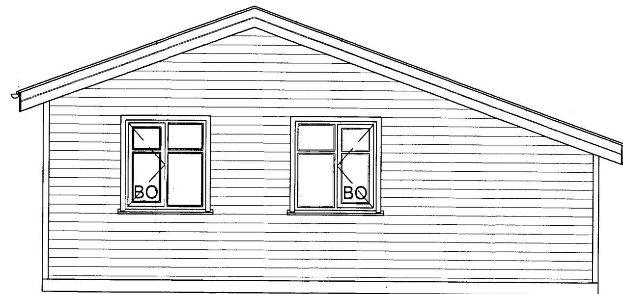
○ Norðurhlið - 1:50