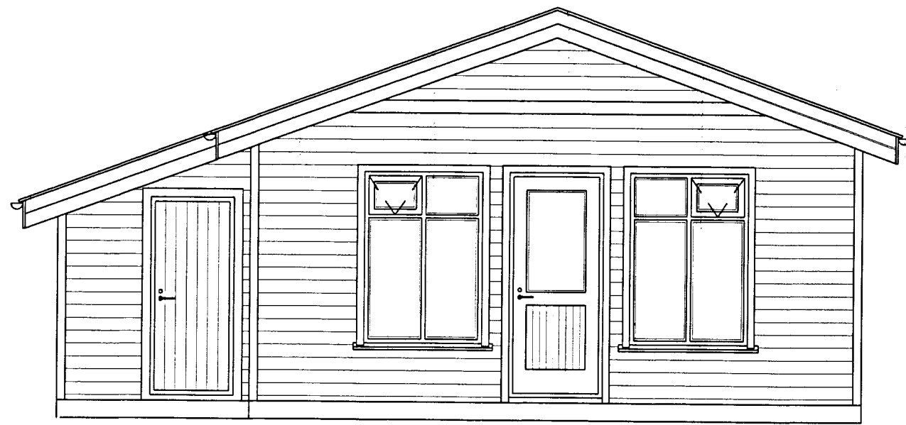
○ Suðurhlið - 1:50