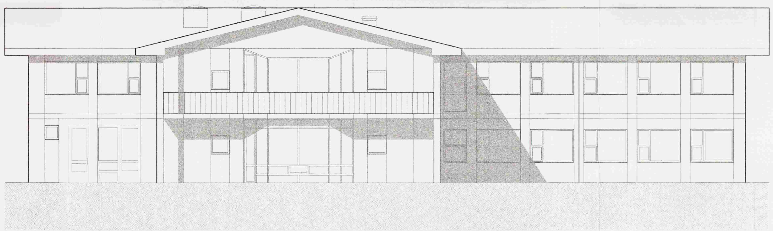
ÚTLIT SUÐ-AUSTUR MKV. 1:100