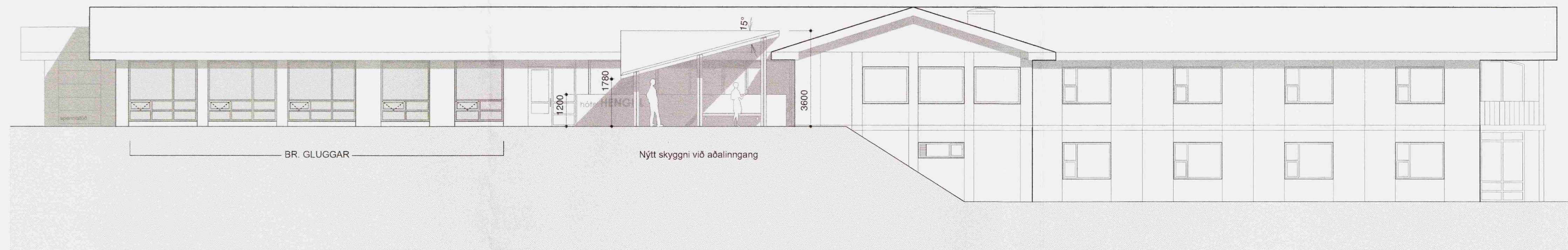
ÚTLIT SUÐ-VESTUR MKV. 1:100

01 Uppfærð teikning 080808 LA sm 00 Ný teikning 200508 HD sm Breyting: Dags: Teikn: Yfir: