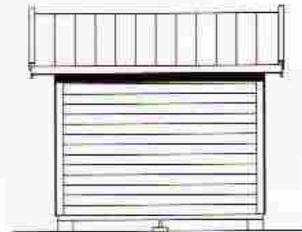
SIDOFASAD SIDE FACADE