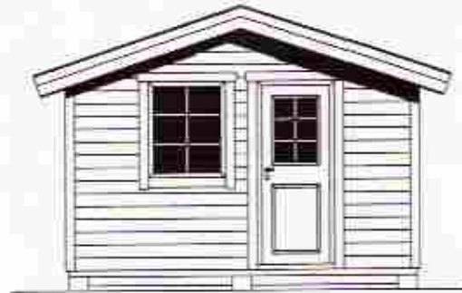
ENTRÉFASAD ENTRANCE FACADE