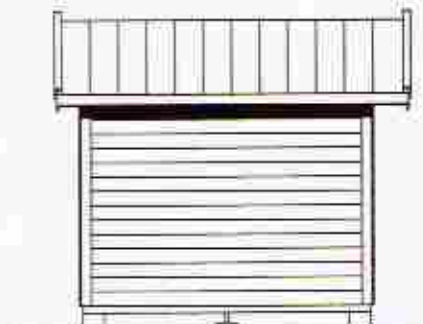
SIDOFASAD SIDE FACADE