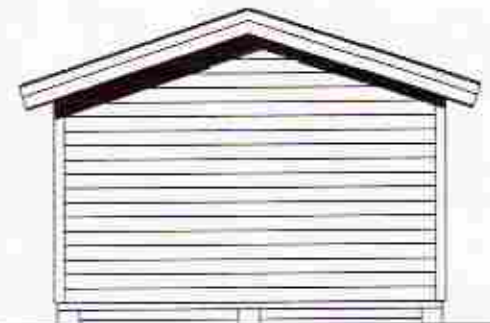
GAVELFASAD GABLE FACADE