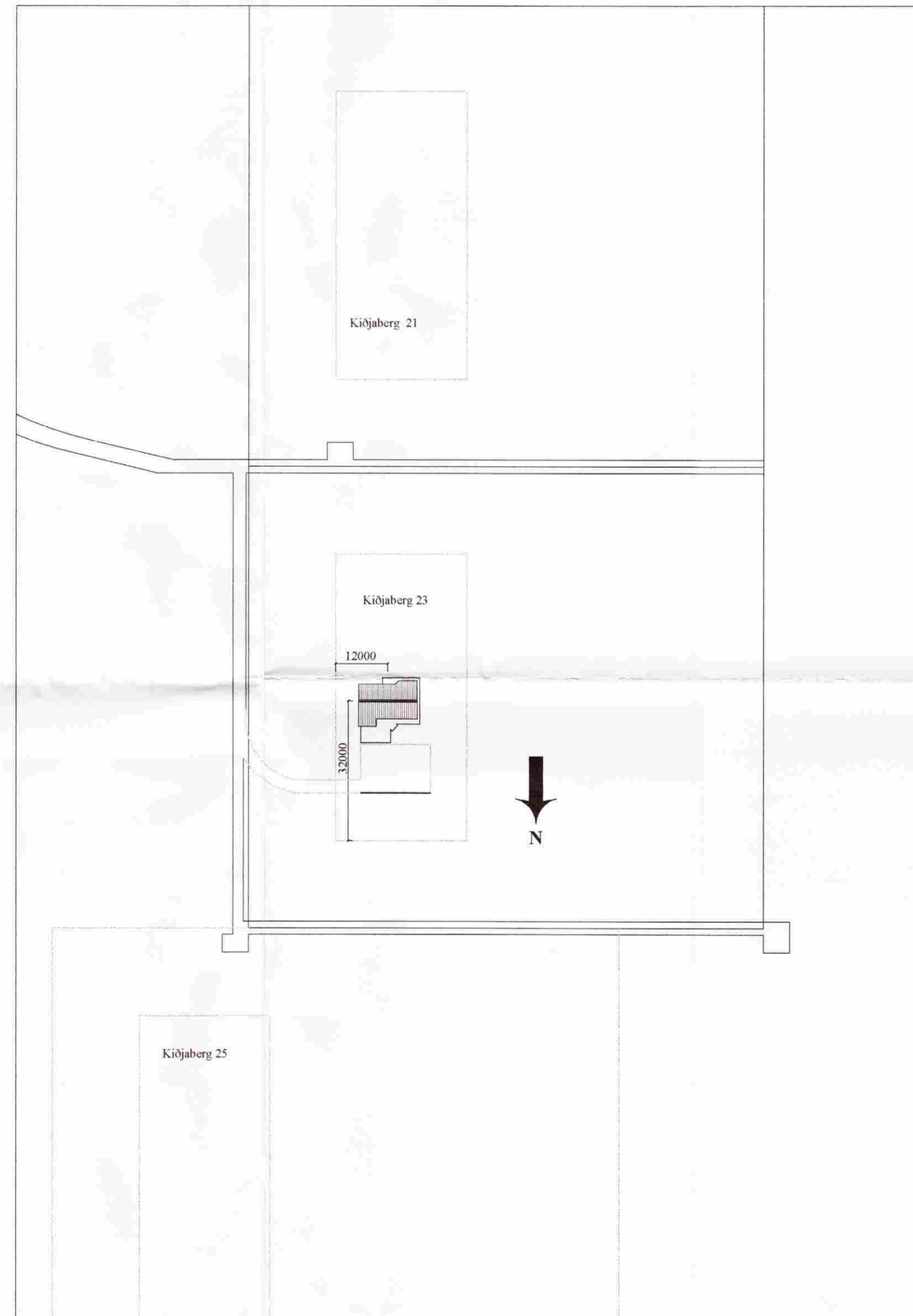
Afstöðumynd - mkv. 1:1000