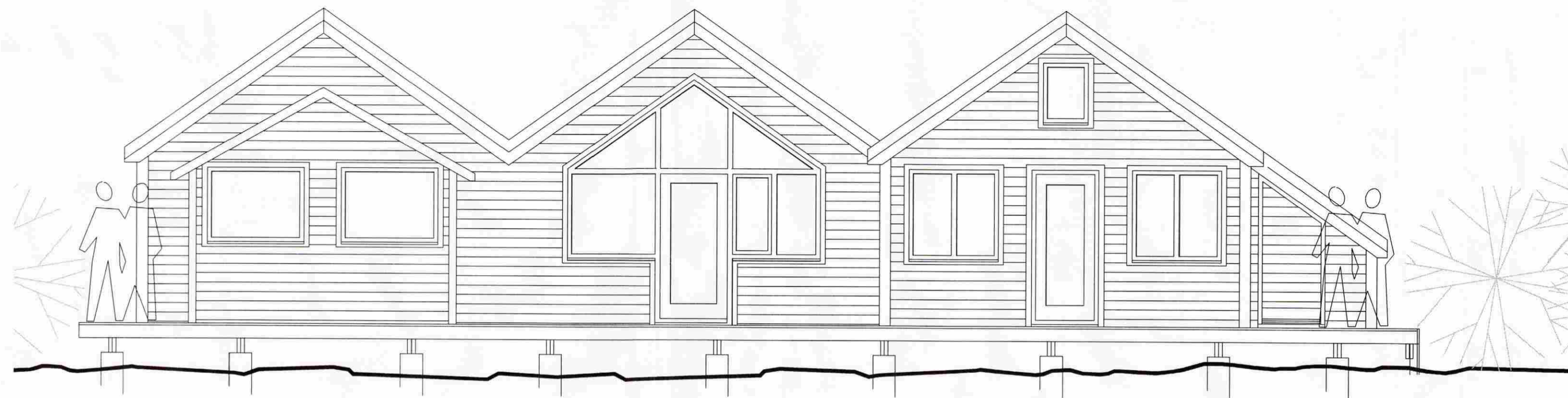
ÚTLIT SUÐ-VESTUR mkv. 1:50