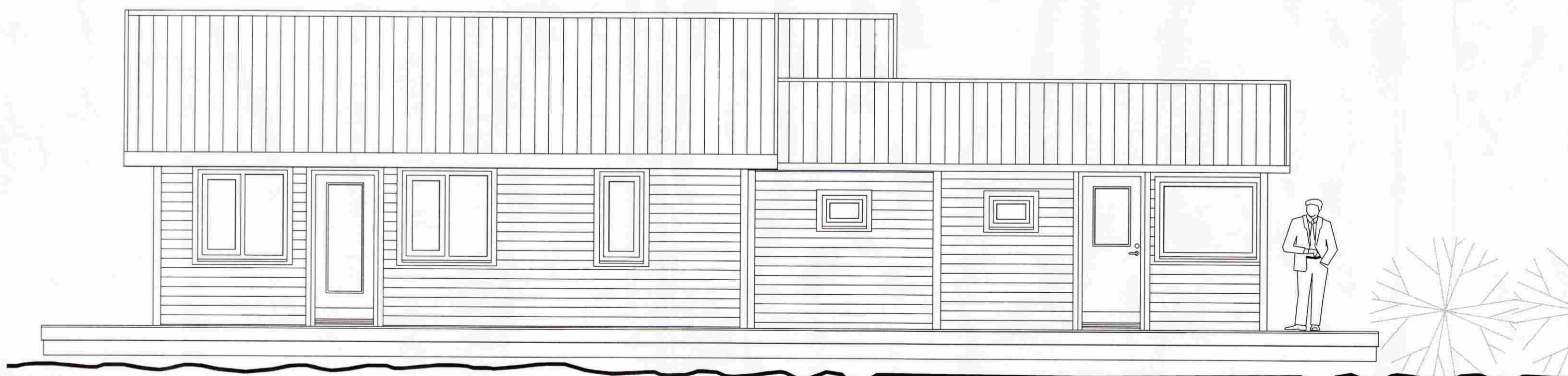
ÚTLIT NORÐ-VESTUR mkv. 1:50