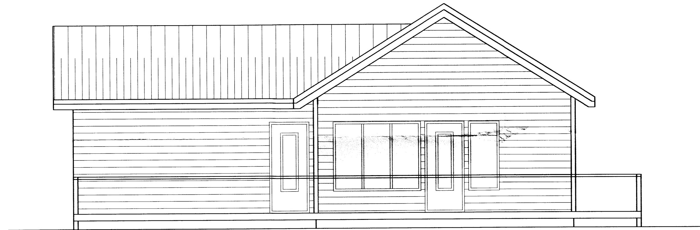
SUÐLÆG HLIÐ 1:50