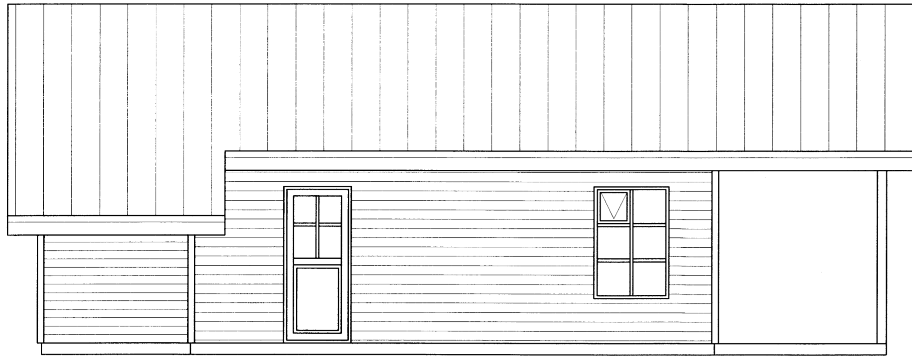
ÚTLIT VESTUR, MKV. 1:50