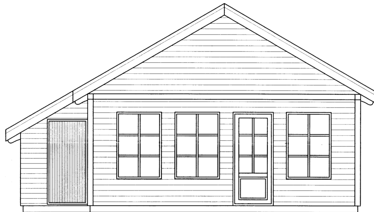
ÚTLIT SUÐUR, MKV. 1:50

Samþykkt 27 MARS 2007 Hilmar Samars Byggingarfulltrúi uppsveita Árnessýslu