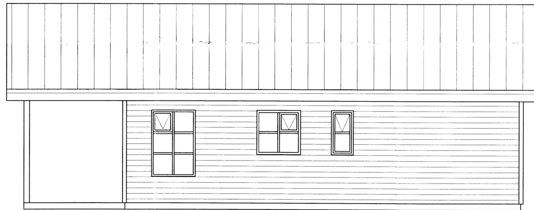
ÚTLIT AUSTUR, MKV. 1:50