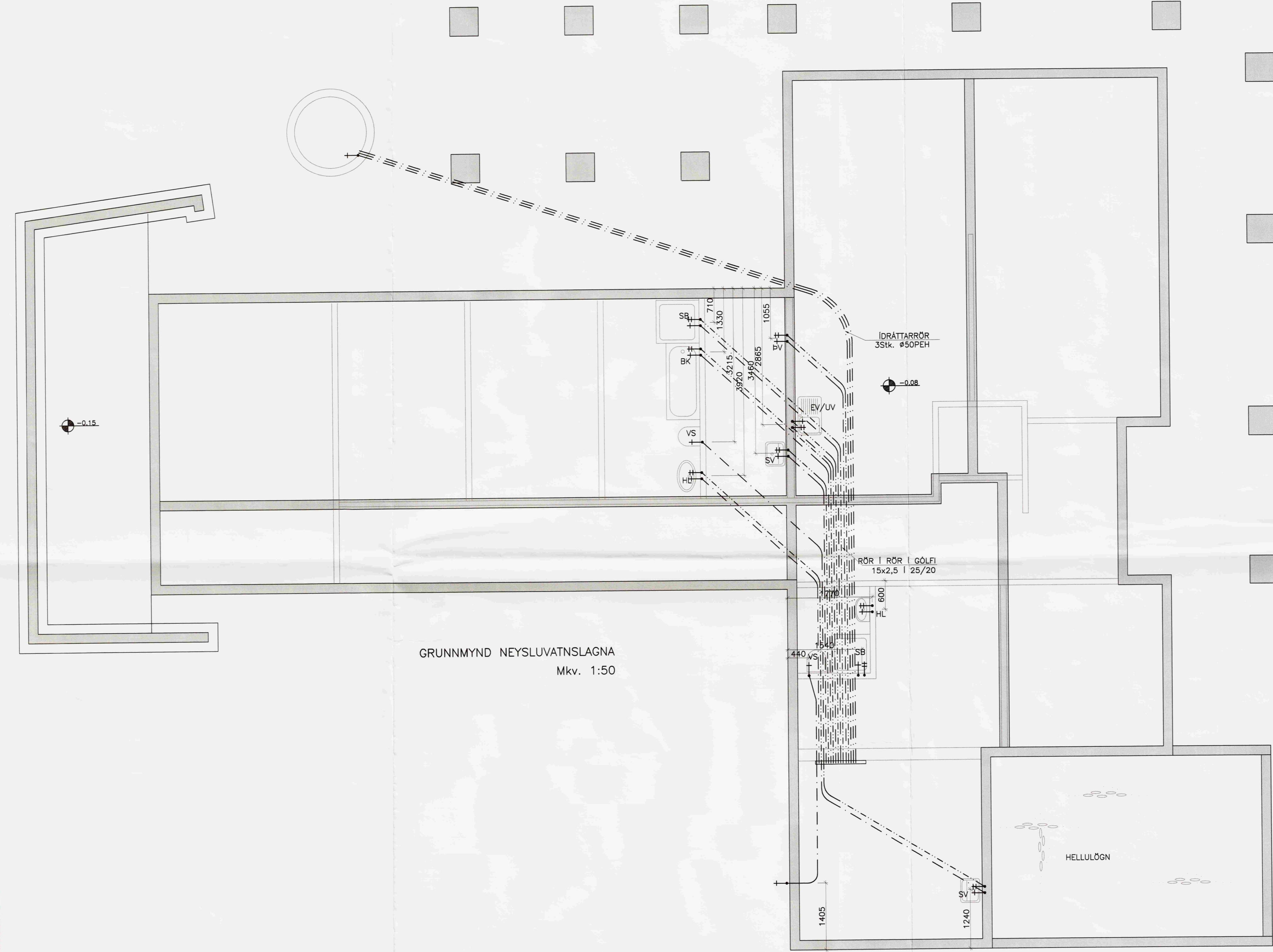
GRUNNMYND NEYSLUVATNSLAGNA Mkv. 1:50