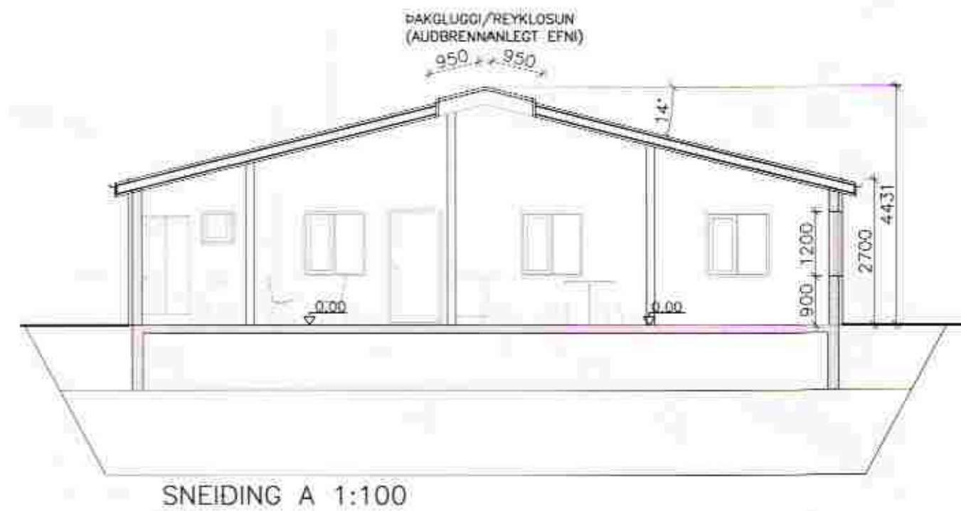
SNEIDING A 1:100