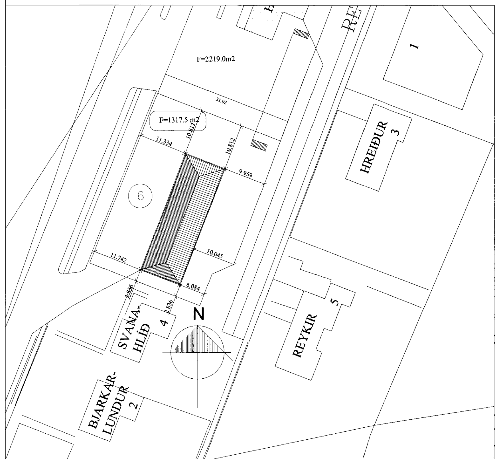
Afstöðumynd Mkv. 1:500

SAMÞYKKT 15 JULI 2010 Bent Larsen Fróðason Byggingafræðingur og skráningartafli