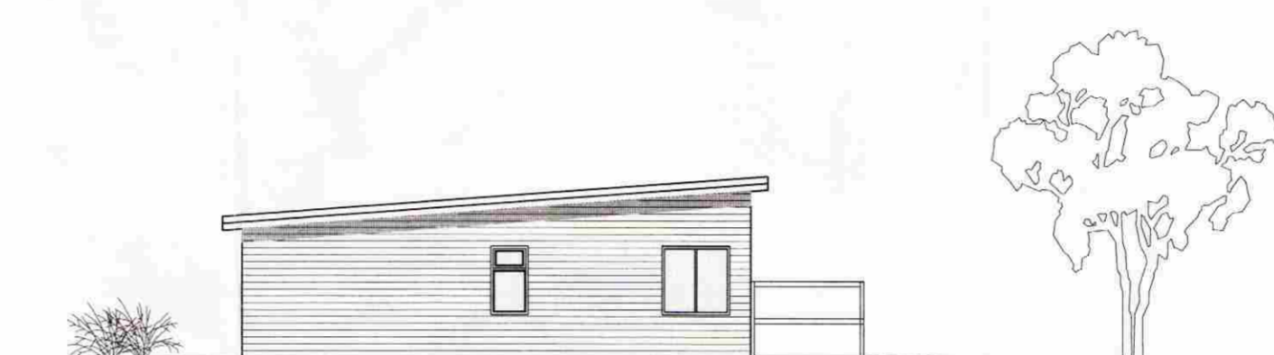
ÚTLIT N. VESTUR