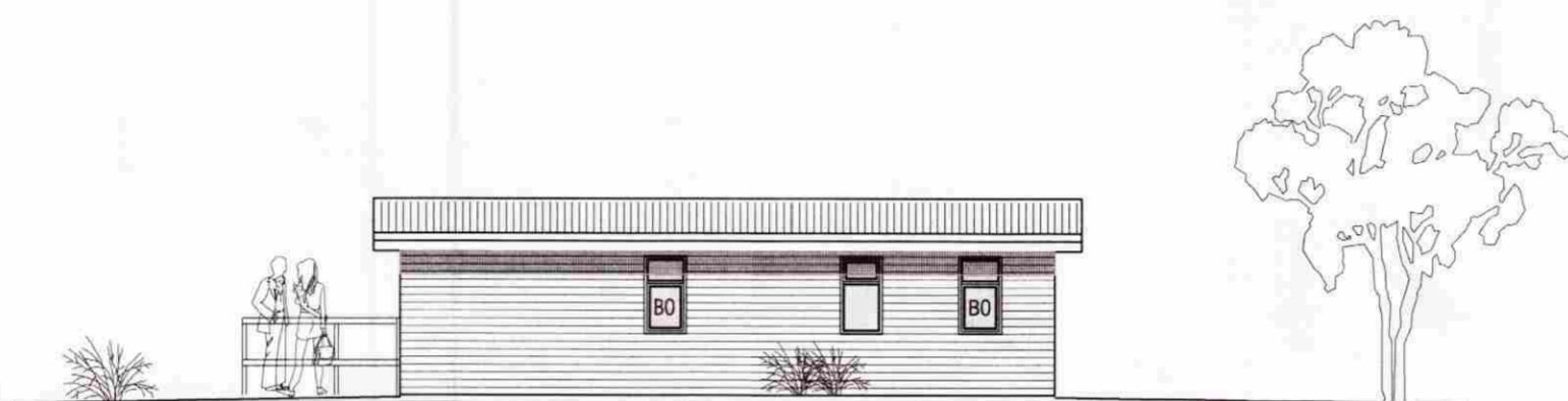
ÚTLIT N. AUSTUR