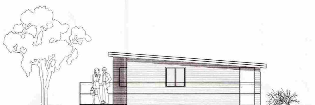
ÚTLIT S. AUSTUR