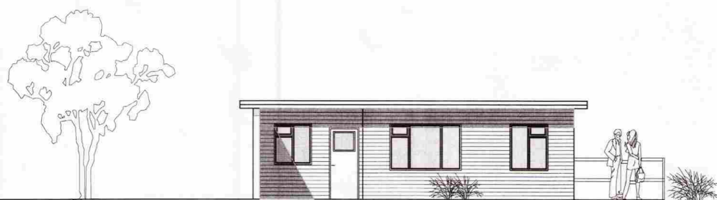
ÚTLIT S. VESTUR