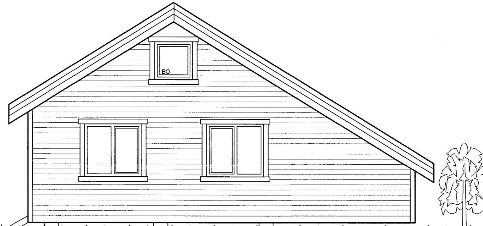
Norðlæg hlið mkv. 1:50