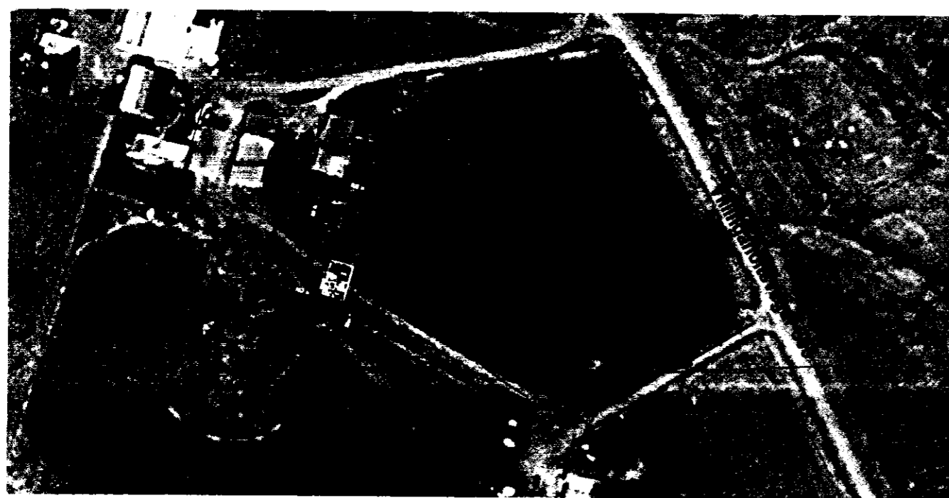
Afstöðumynd 2 1:1.000