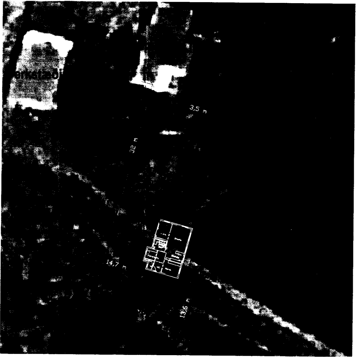
Afstöðumynd 3 1:500