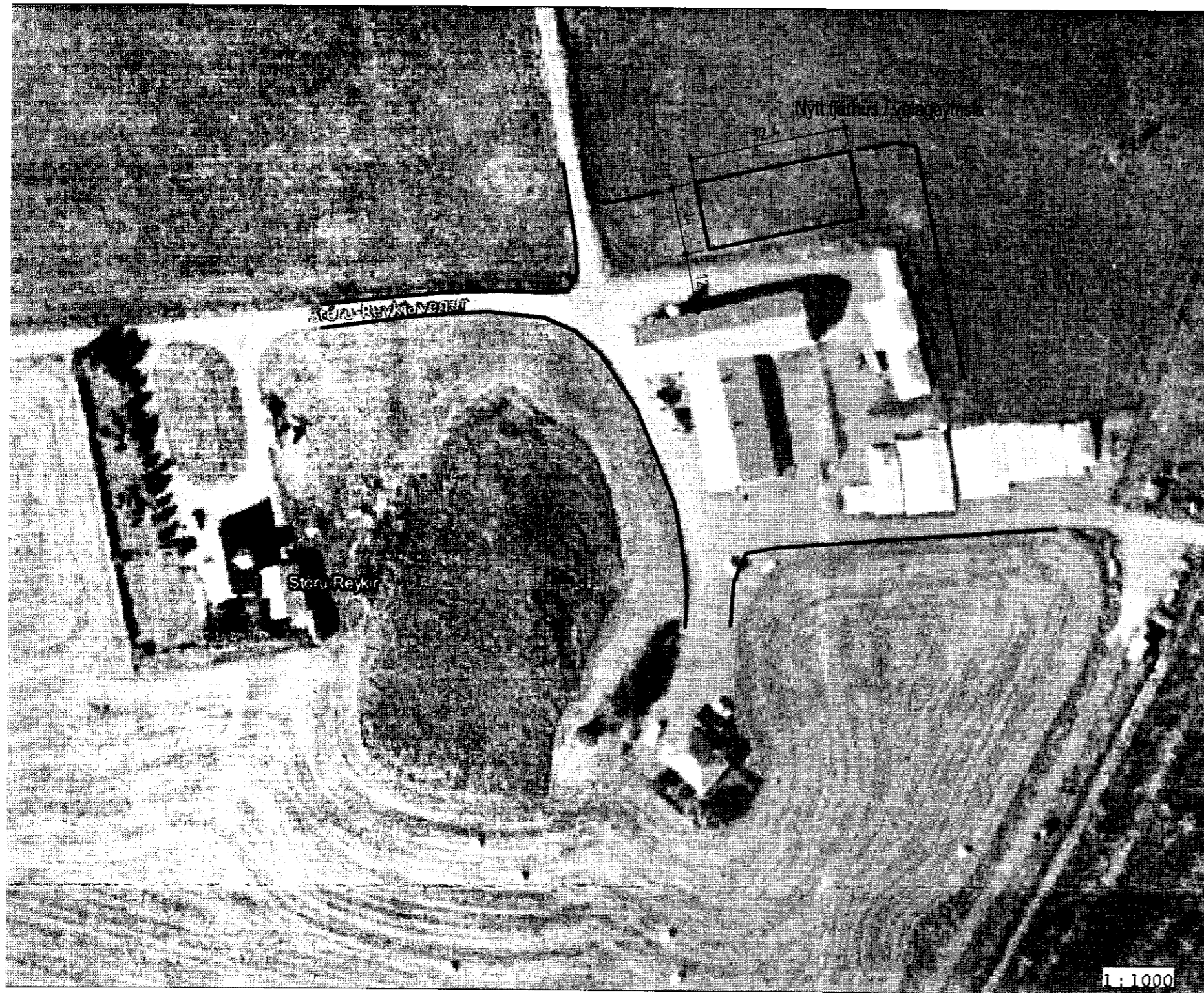
Afstöðumynd mkv. ca. 1 : 1000 Grunnur : Loftmyndir ehf