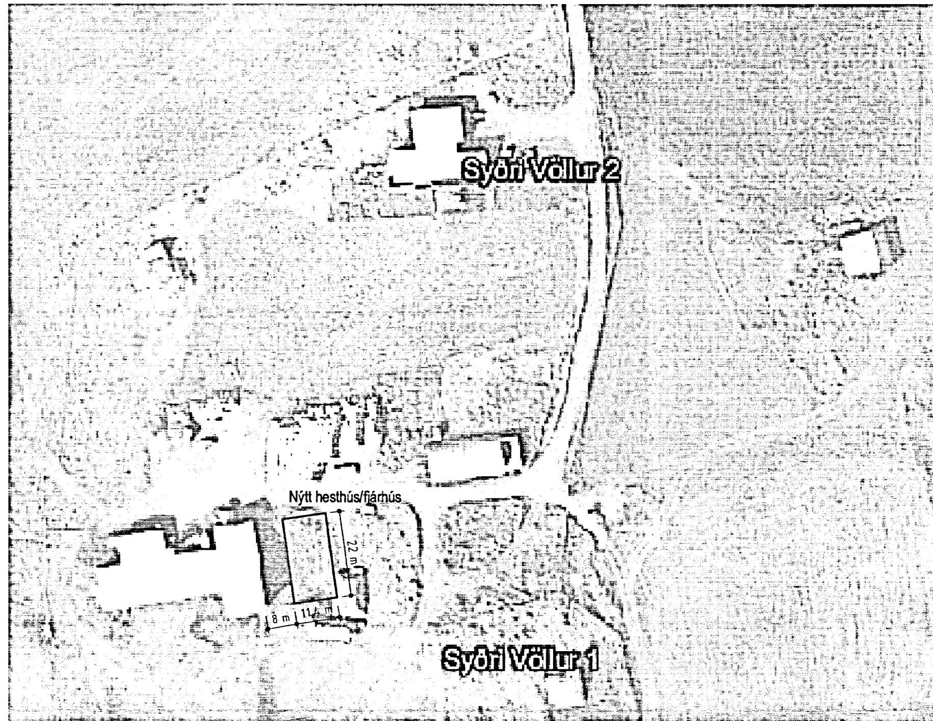
Mynd: Loftmyndir ehf. Mælikvarði ca. 1 : 1000