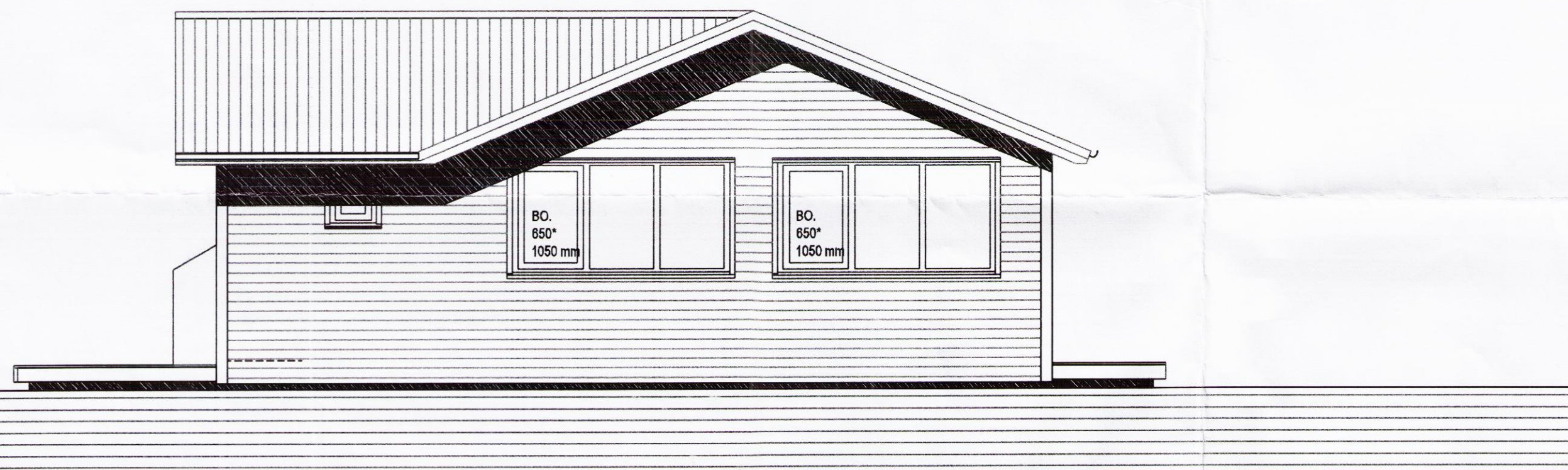
ÚTLIT AUSTUR, MKV. 1:50.