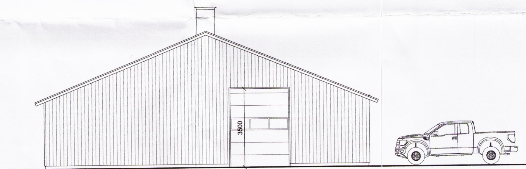
Útlit suð-vestur hlið M 1:100