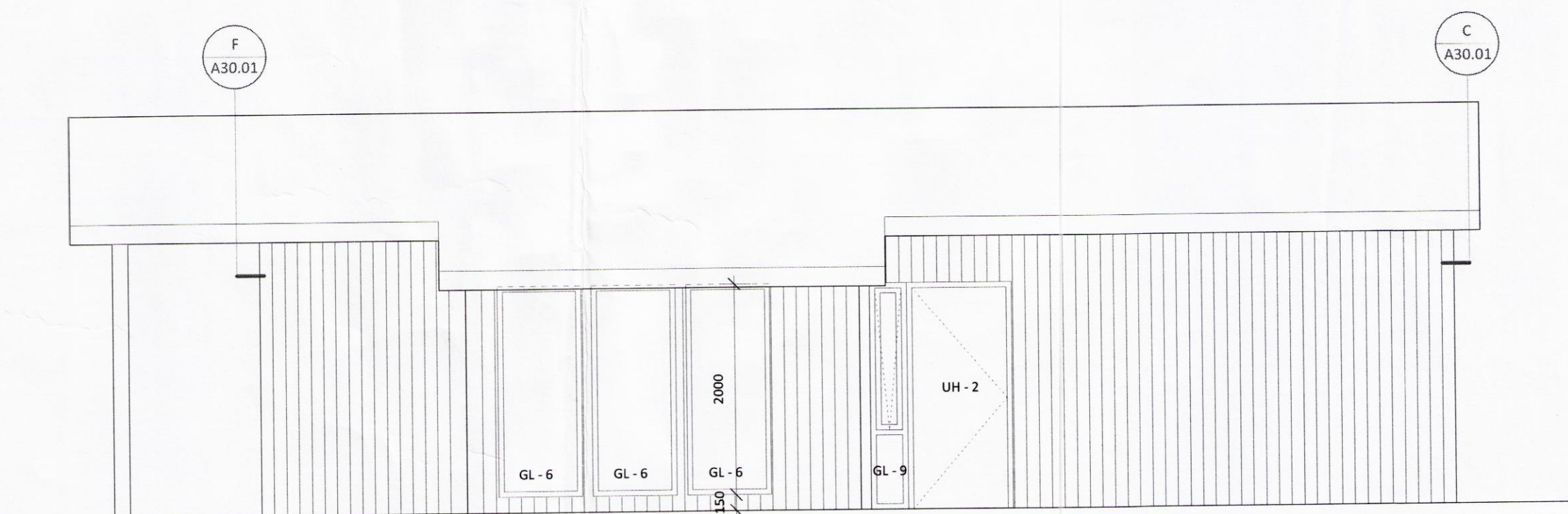
NORÐAUSTURHLIÐ, M.KV. 1:50

Skipulags- og byggingarfulltrúi Uppsveita bs. Samþykkt 03 AUG. 2016 Rúnir Jónsson Byggingarfulltrúi