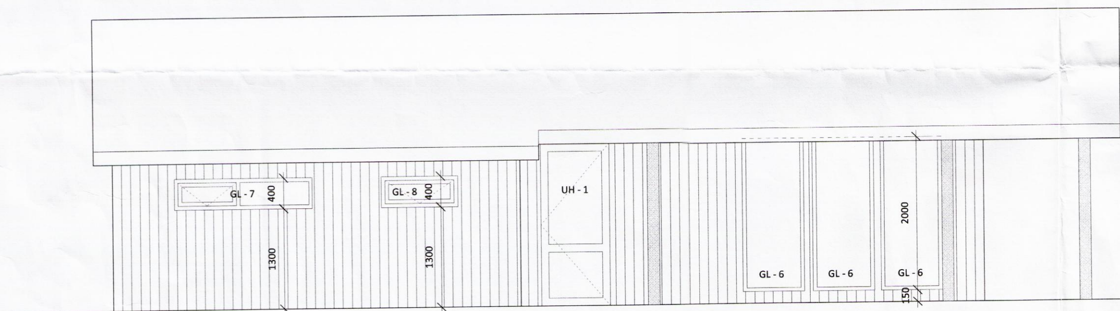
SUÐVESTURHLIÐ, M.KV. 1:50