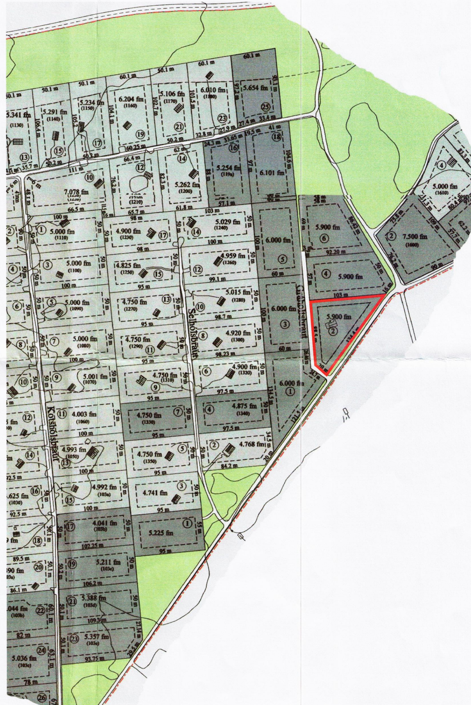
STAÐSETNING MÆLIKVARÐI: 1:3000