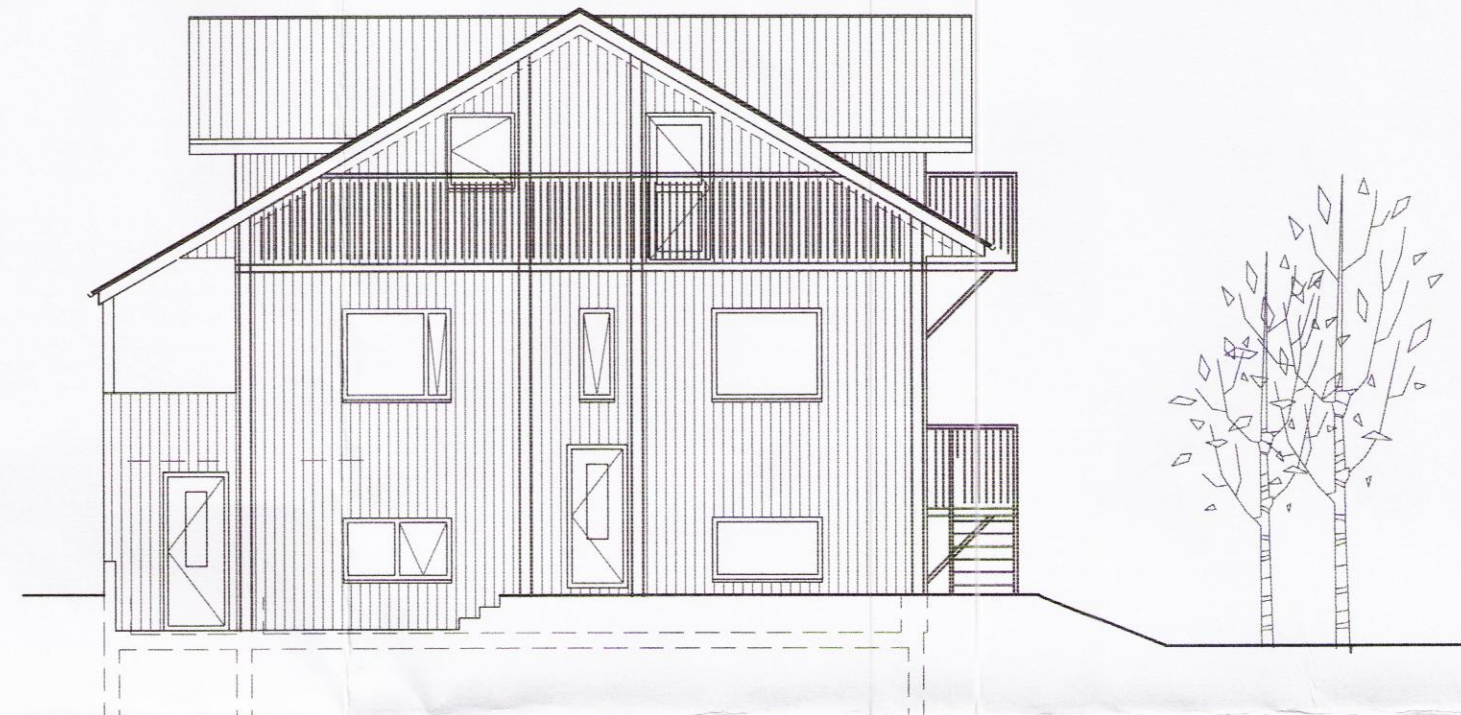
Útlit vesturhlíð eftir breytingu M 1:100