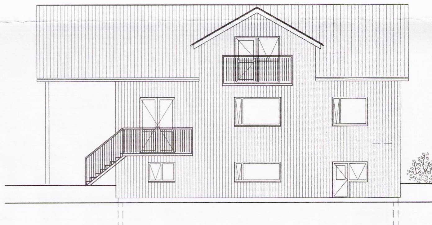
Útlit suðurhlíð eftir breytingu M 1:100