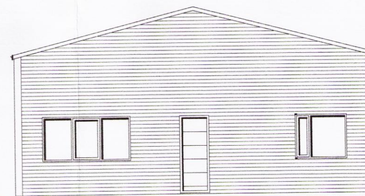
Norðvesturhlíð M 1:100

Skilpulegs- og byggingarfulltrúi Uppsvalta bs. Samþykkt 28 OKT. 2015 Andri Snær Byggingarfulltrúi