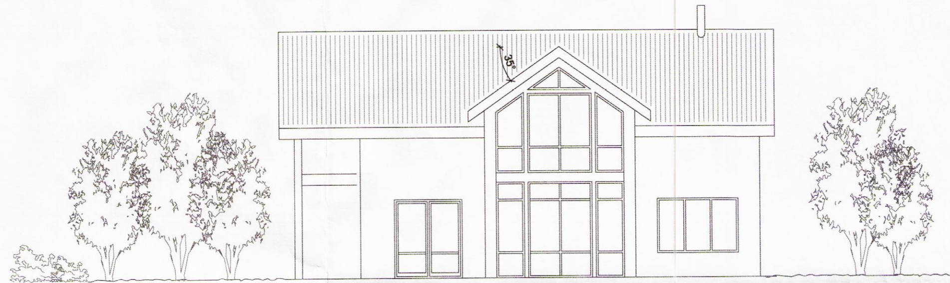
Útlit suðvestur M 1:100