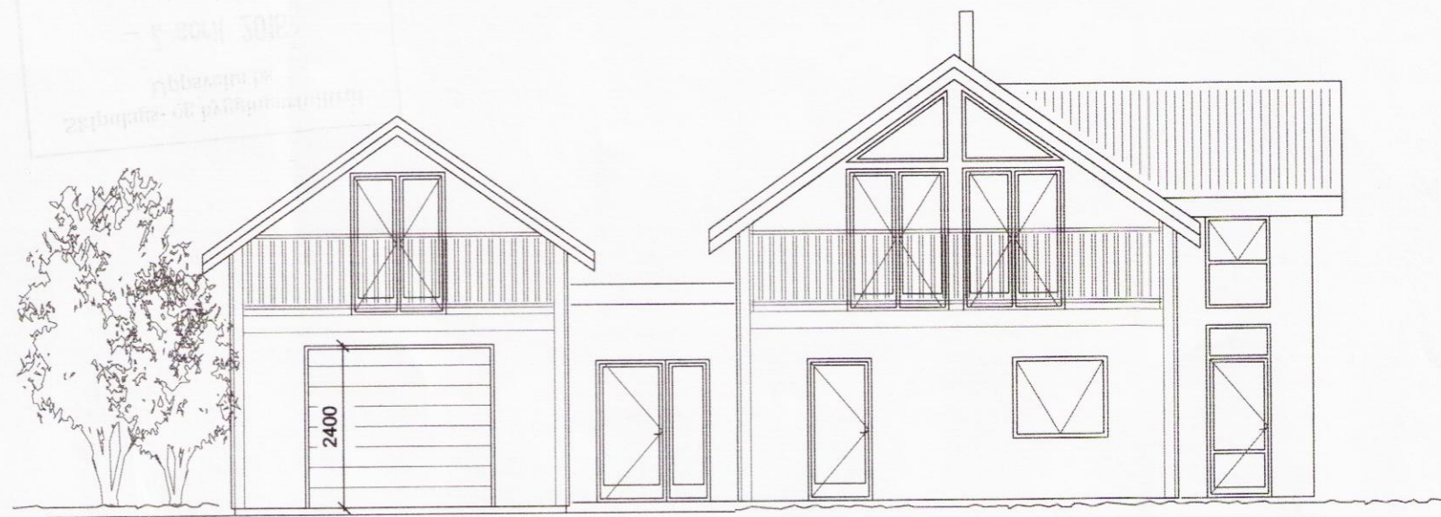
Útlit norðvestur M 1:100