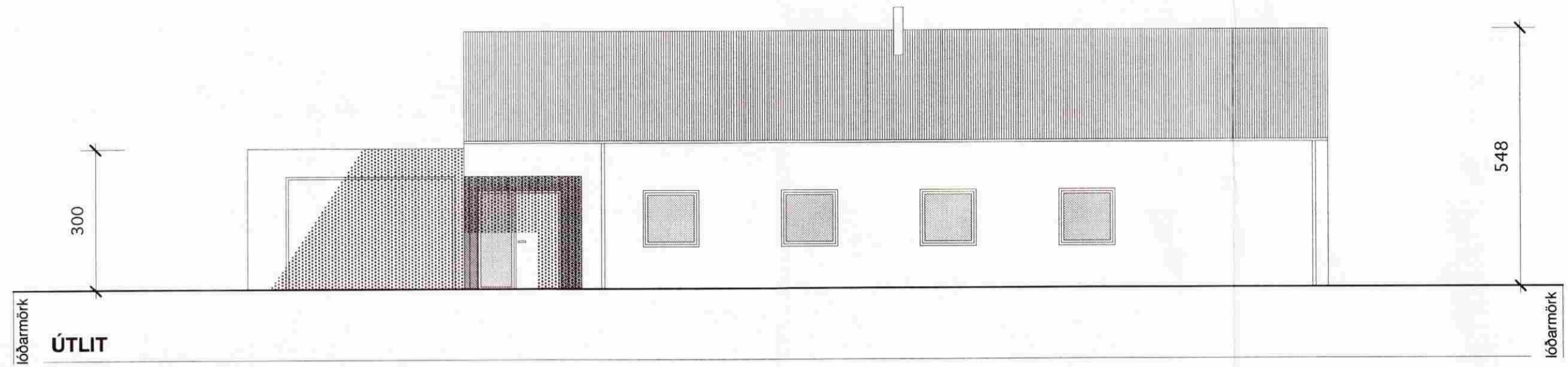
lóbarmörk ÚTLIT mkv. 1:100