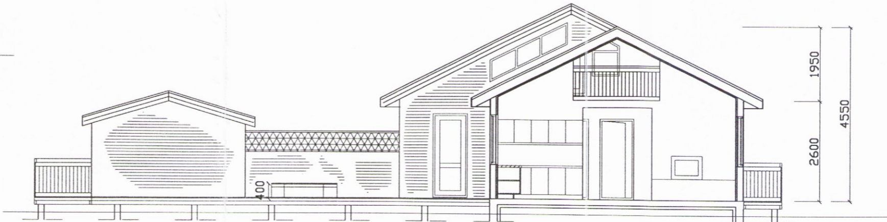
Snið B-B 1:100