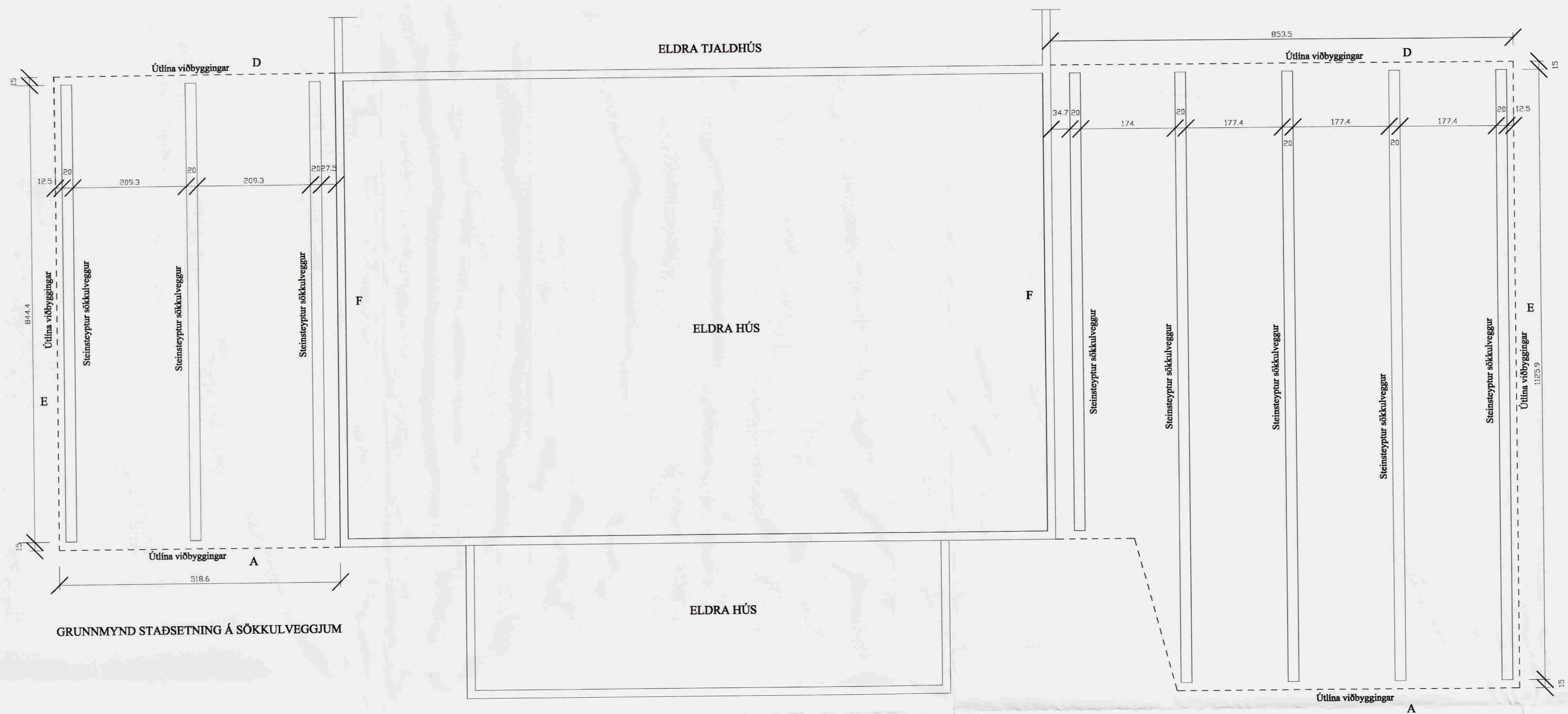
GRUNNMYND STAÐSETNINGU Á SÖKKULVEGGJUM

Samþykkt 10. APR. 2008 Byggingarfulltrúi uppsveita Árnassýslu