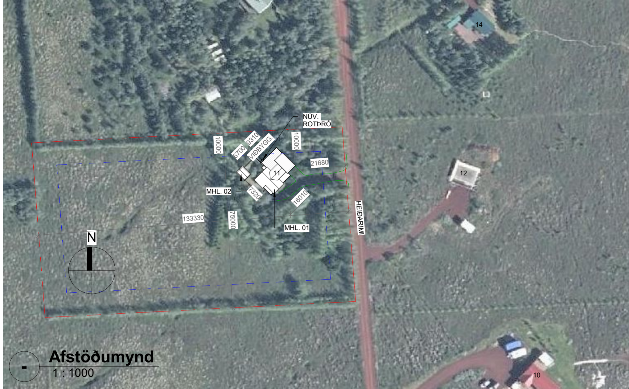
Afstöðumynd 1 : 1000