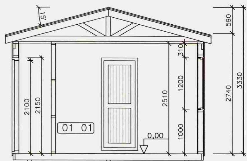
SNID A-A 1:50