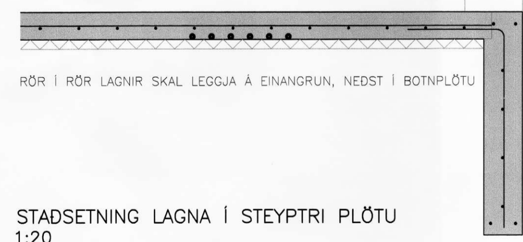
STADSETNING LAGNA Í STEYPTRI PLÖTU 1:20