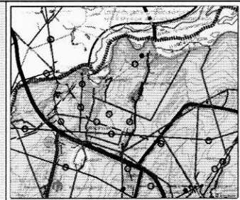
Hluti af aðalskipulagi Ásahrepps 2002-2014. m.kv. 1:50,000